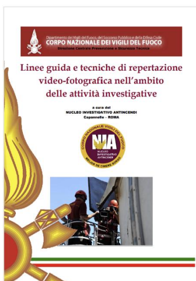
Linee guida e tecniche di repertazione video-fotografica nell'ambito delle attività investigative - Data pubblicazione: 20/07/2016