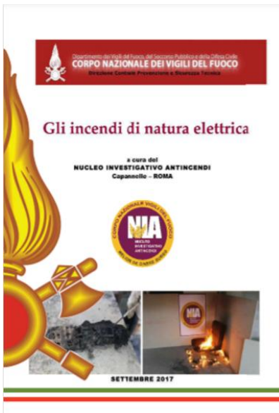
Gli incendi di natura elettrica - Data pubblicazione: 26/09/2017