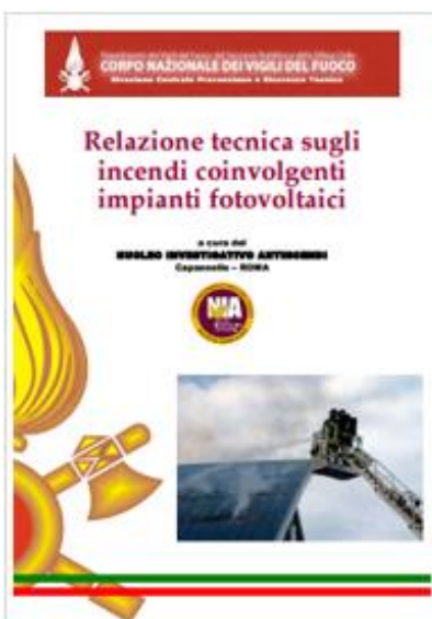
Relazione tecnica sugli incendi coinvolgenti gli impianti fotovoltaici - Data pubblicazione: 20/10/2015