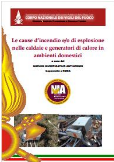
Le cause d'incendio e/o di esplosione nelle caldaie e generatori di calore in ambienti domestici - Data pubblicazione: 18/02/2016