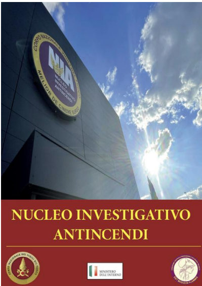
Nucleo Investigativo Antincendi 2004 - 2024 - Data pubblicazione: 23/04/2024