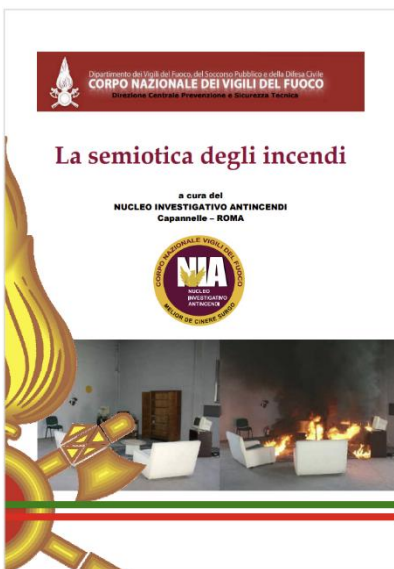
La semiotica degli incendi - Data pubblicazione: 25/11/2015