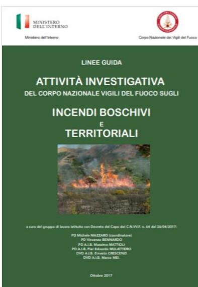
Linee guida attività investigativa del Corpo nazionale vigili del fuoco sugli incendi boschivi e territoriali - Data pubblicazione: 21/12/2017