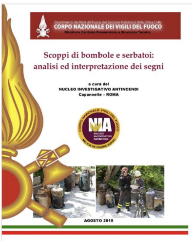
Scoppi di bombole e serbatoi: analisi ed interpretazione dei segni - Data pubblicazione: 30/08/2019