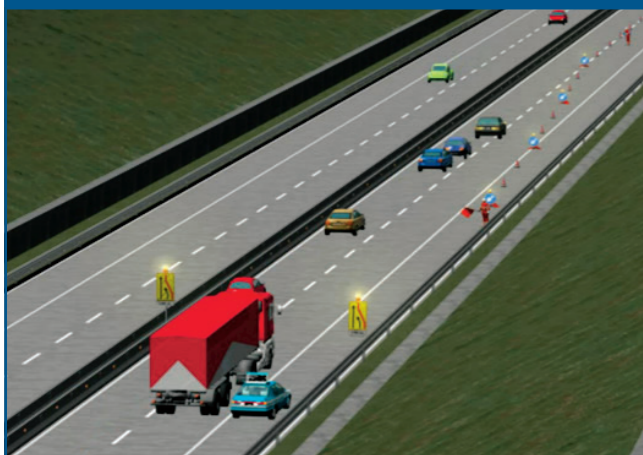
Figura 5 Misura organizzativa: adeguato allestimento di cantiere stradale su strada extraurbana con due corsie per senso di marcia

(Inail - Dipartimento di medicina, epidemiologia, igiene del lavoro e ambientale)