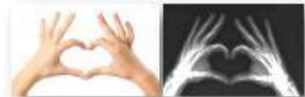
Cosa si vede con la luce...e con i raggi X

I raggi X sono una forma di radiazione proprio come la luce, ma non sono visibili! Essi hanno un elevato potere di penetrazione infatti possono «attraversare» il corpo umano. Per questo motivo, utilizzando strumenti e tecniche adeguate, vengono sfruttati per produrre immagini delle strutture interne del corpo.