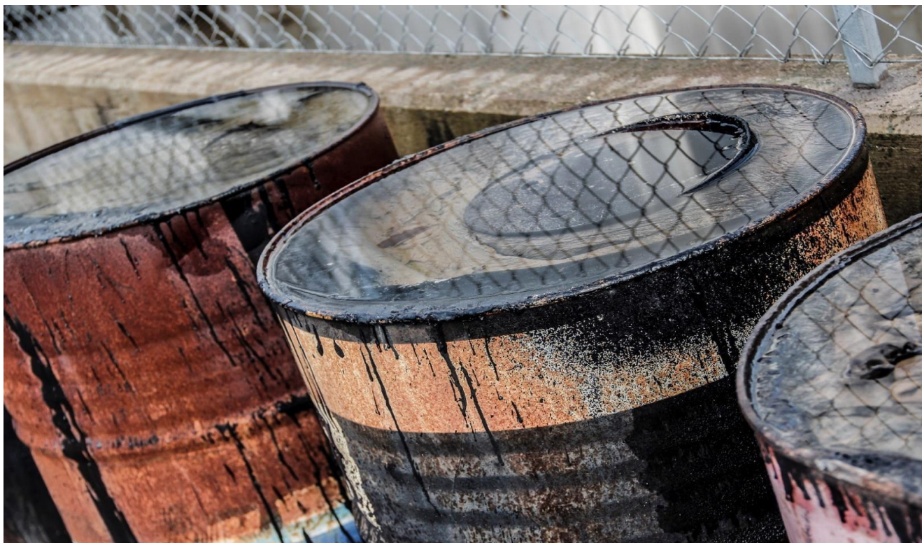
Tabella Rifiuti HP / CLP / ADR