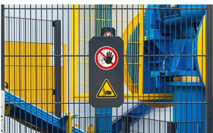
Tavola di concordanza estesa RESS Direttiva / Reg. Macchine