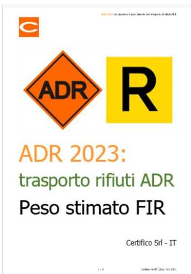
ADR 2023: peso stimato nel trasporto di rifiuti ADR