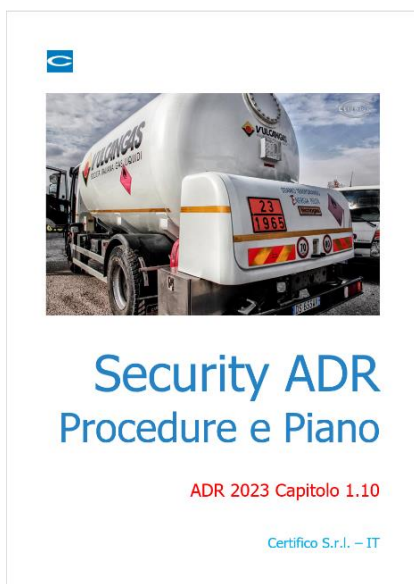
Security ADR: Procedure e Piano