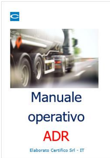
Manuale operativo ADR