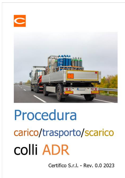
Procedura carico / trasporto / scarico colli ADR