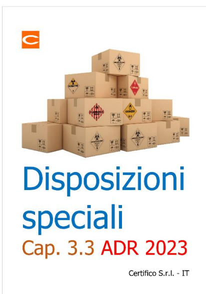
Disposizioni speciali: Capitolo 3.3 ADR 2023