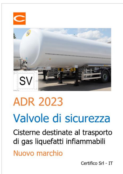
Valvole di sicurezza - Cisterne gas liquefatti infiammabili