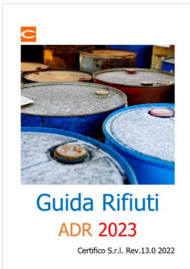
Guida Rifiuti ADR 2023