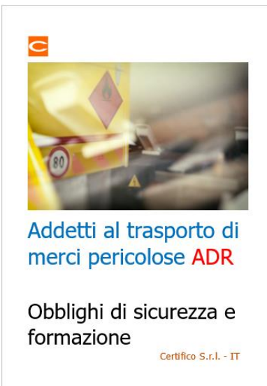
Addetti trasporto merci pericolose ADR: Obblighi e Formazione