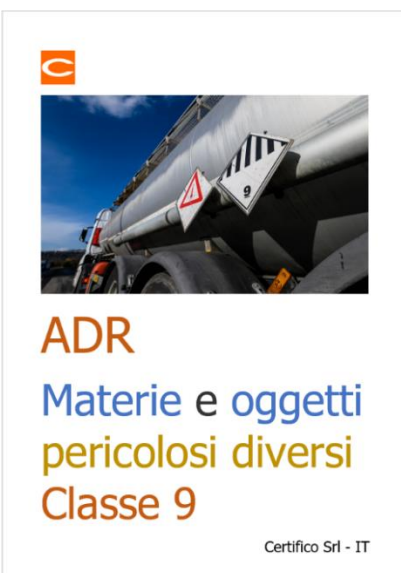
ADR: Materie e oggetti pericolosi diversi Classe 9