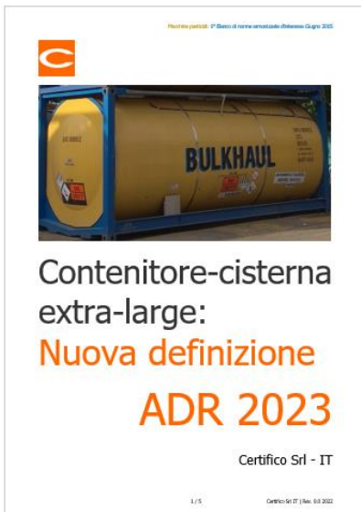
Contenitore-cisterna extra-large: nuova definizione ADR 2023