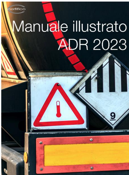
Manuale illustrato ADR 2023