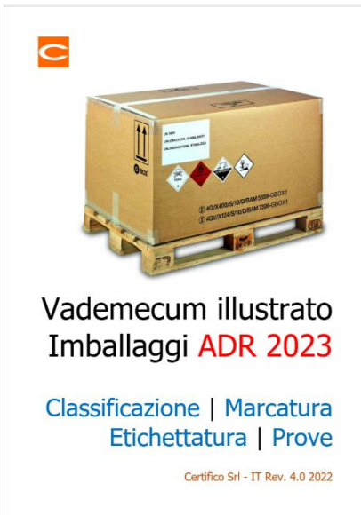
Vademecum illustrato Imballaggi ADR 2023