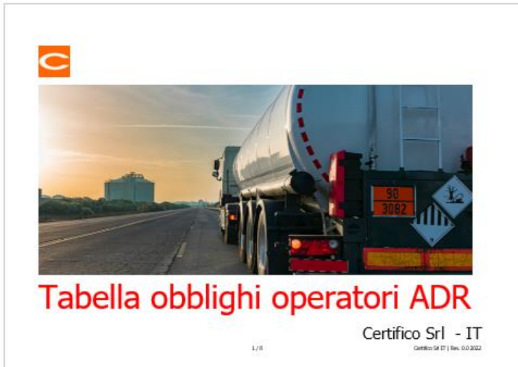
Tabella obblighi operatori ADR / ADR 2023