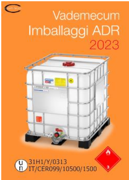
Vademecum illustrato Imballaggi ADR 2023