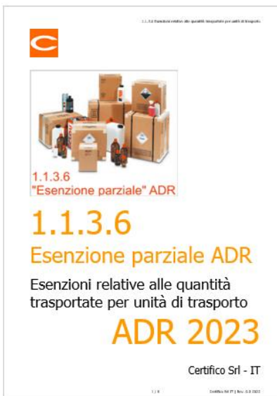
ADR: Esenzioni parziali 1.1.3.6