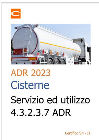
Cisterne Servizio ed utilizzo 4.3.2.3.7 ADR