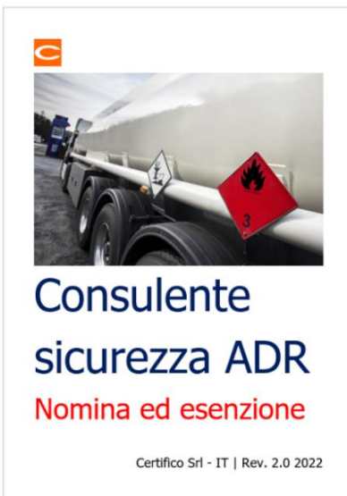
Consulente ADR: Obbligo ed esenzione nomina