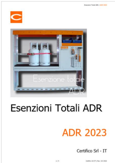
Esenzioni totali ADR