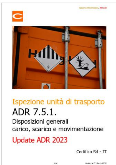
Ispezione unità di trasporto ADR 7.5.1