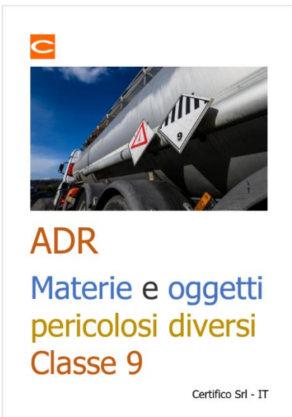
ADR: Materie e oggetti pericolosi diversi Classe 9