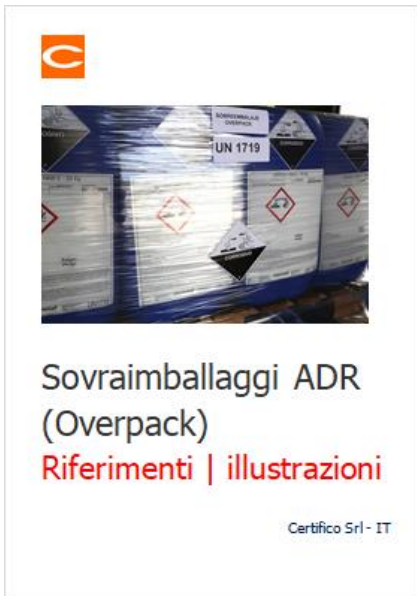
Sovraimballaggi ADR (Overpack) | Riferimenti e illustrazioni