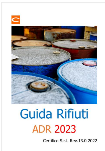
Guida Rifiuti ADR 2023