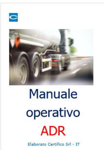
Manuale operativo ADR