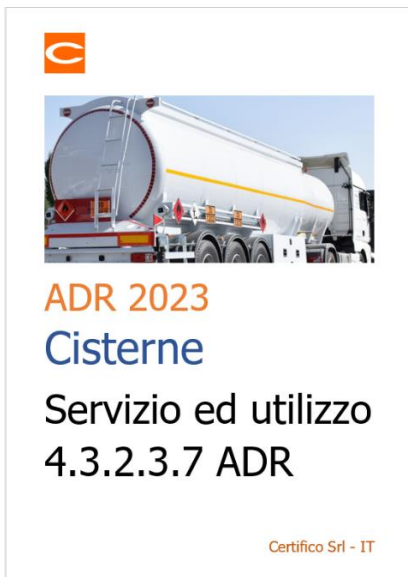
Cisterne Servizio ed utilizzo 4.3.2.3.7 ADR