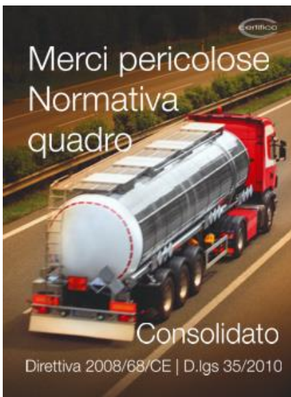
Normativa quadro Merzi Pericolose