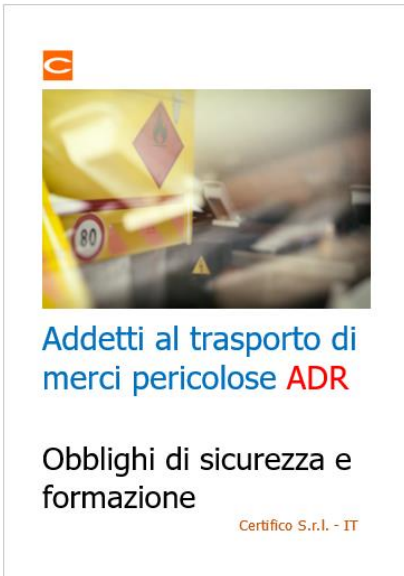
Addetti trasporto merci pericolose ADR: Obblighi e Formazione