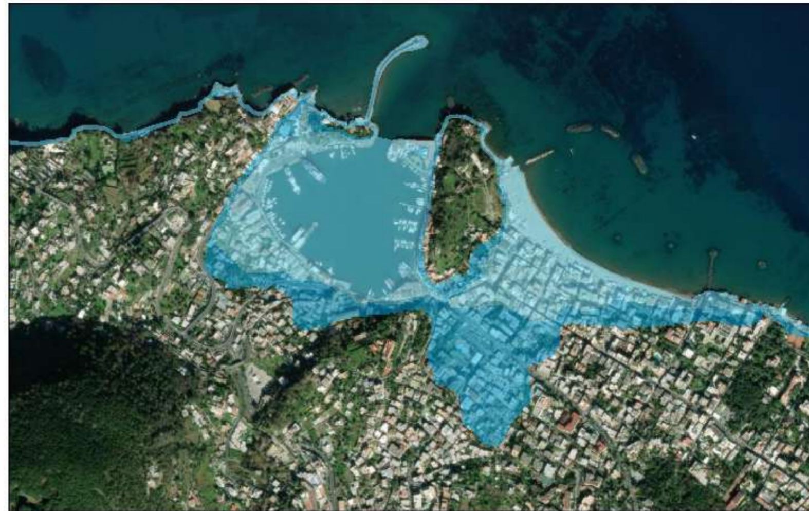
Mappa di inondazione