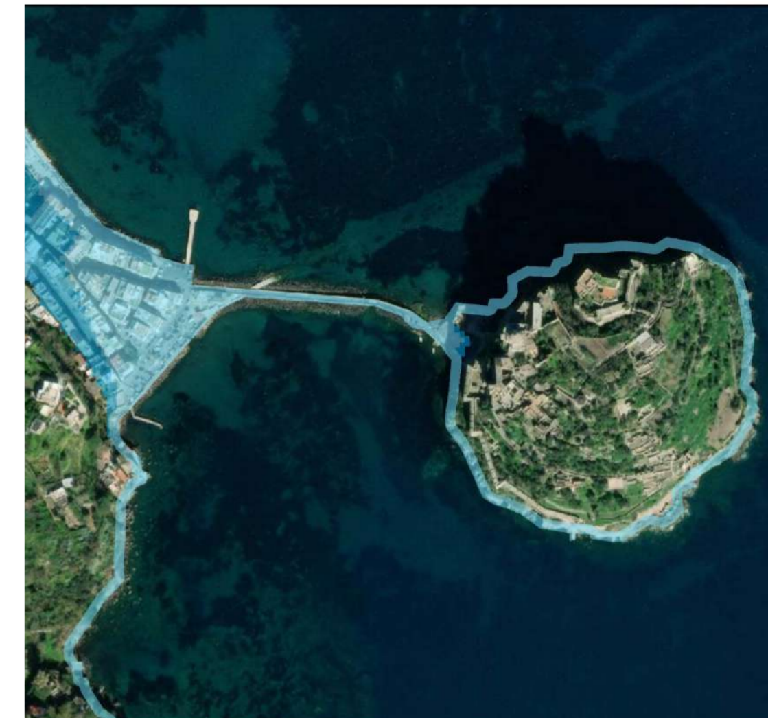
Mappa di inondazione