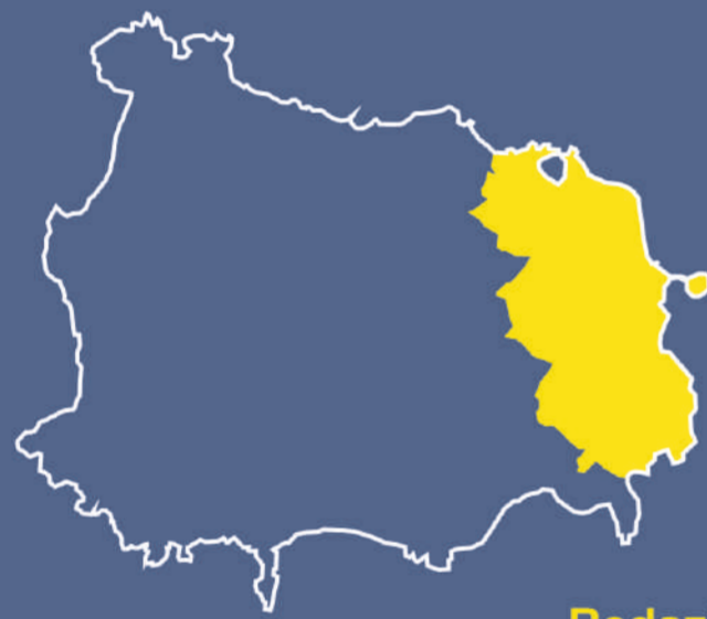
TAVOLA 6a - MAPPA DI INONDAZIONE SIAM - Sistema Allerta Maremoto Sismoindotto Fonte INGV - ISPRA: Tsunami Map Viewer

Programma Operativo Complementare 2014-2020 D.G.R. n° 665 del 29/11/2016 DD Dg5009 n° 74 del 30/8/2017 e s.m.c.