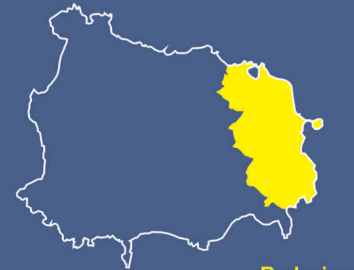
TAVOLA 13b Sviluppo della rete fognaria comunale