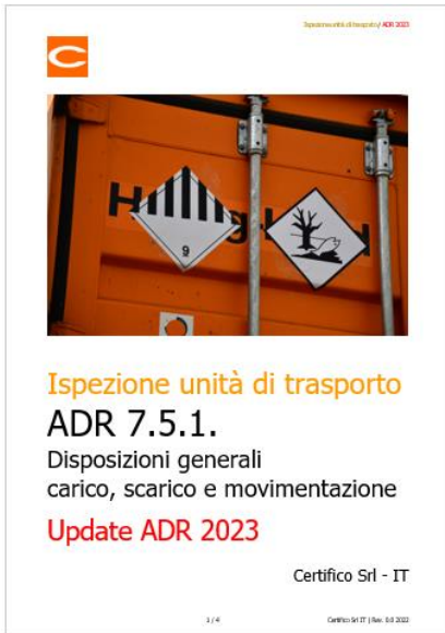
Ispezione unità di trasporto ADR 7.5.1