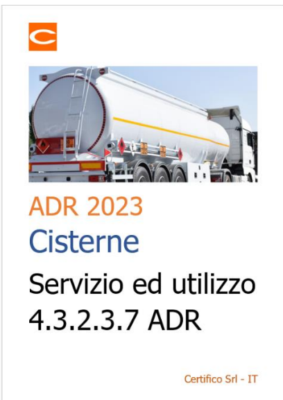
Cisterne Servizio ed utilizzo 4.3.2.3.7 ADR