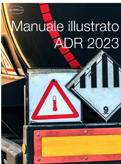
Manuale illustrato ADR 2023