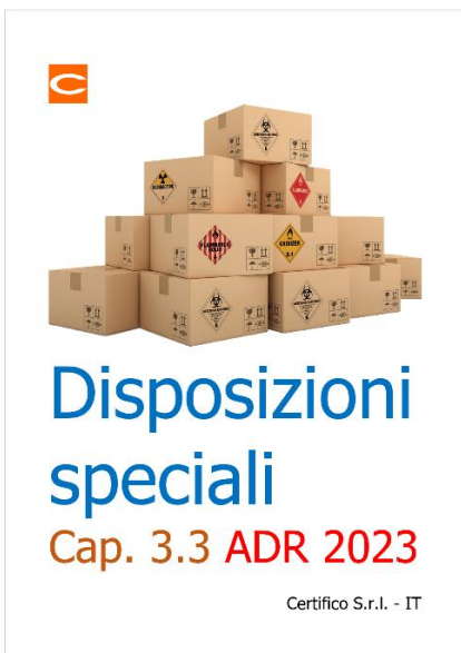
Disposizioni speciali: Capitolo 3.3 ADR 2023