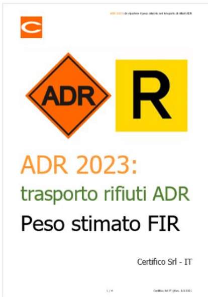
ADR 2023: peso stimato nel trasporto di rifiuti ADR