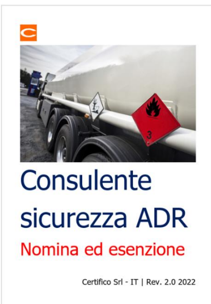
Consulente ADR: Obbligo ed esenzione nomina