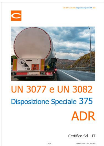
UN 3077 e UN 3082: Disposizione Speciale 375 ADR