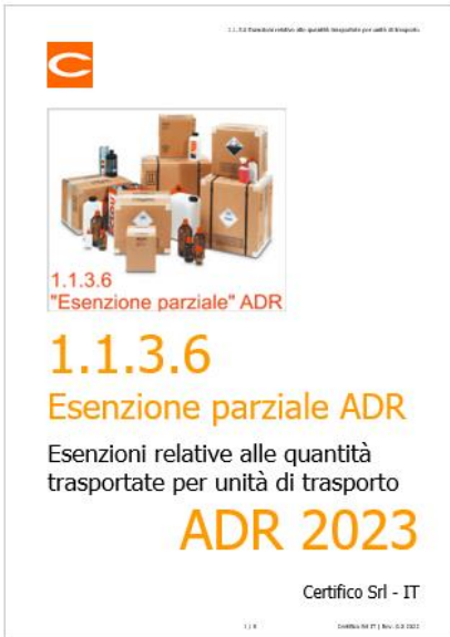
ADR: Esenzioni parziali 1.1.3.6