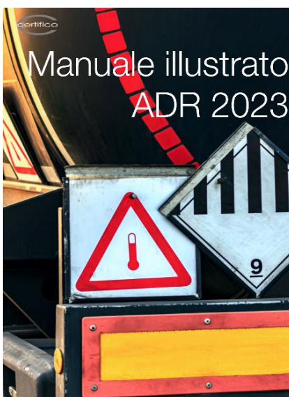
Manuale illustrato ADR 2023