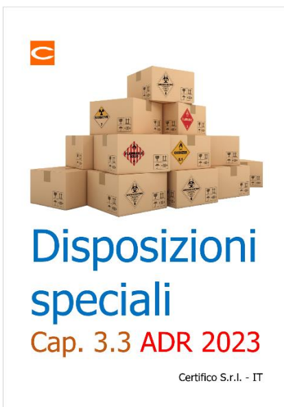
Disposizioni speciali: Capitolo 3.3 ADR 2023