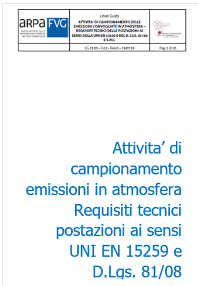
Campionamento emissioni in atmosfera - Requisiti tecnici postazioni / ARPA FVG 2019