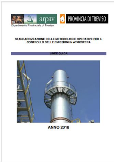
Standardizzazione metodologie operative controllo emissioni in atmosfera ARPAV 2018