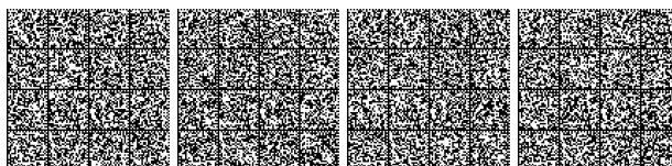
Tabella "D": quantità minima indispensabile del materiale sanitario che deve essere contenuto nelle cassette di pronto soccorso che devono far parte della dotazione di bordo delle: