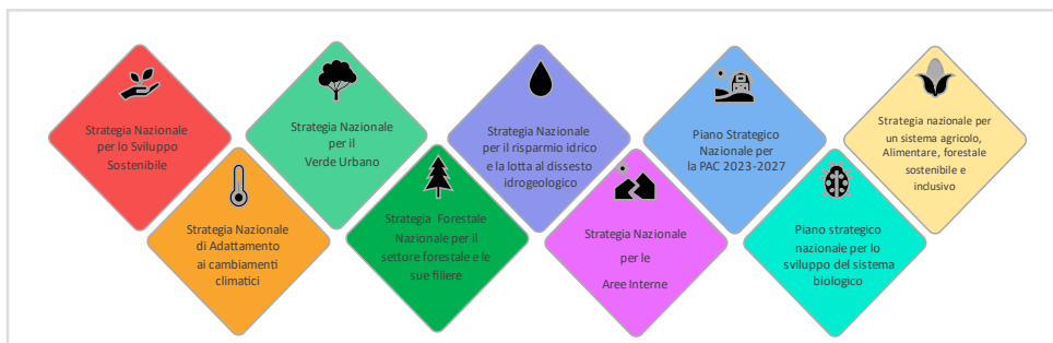
Figura 2: Altri strumenti strategici nazionali

Inoltre, tiene conto del valore della biodiversità per il contrasto ai cambiamenti climatici, la salute e l'economia, contribuisce al raggiungimento degli obiettivi dell'Agenda 2030 e si integra ad altri strumenti strategici nazionali (fig. 1)