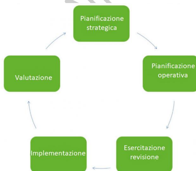
Figura 2 – Elementi chiave del ciclo di pianificazione pandemico

Per questo, la prossima pandemia influenzale potrebbe differire da quanto pianificato ed è necessario sia preparare ed esercitare le capacità di risposta secondo schemi internazionali codificati e scenari attesi, sia rafforzare competenze di indagine e analisi che consentano rapidamente e con flessibilità durante la fase di allerta pandemica di adattare e modulare gli strumenti disponibili alle nuove contingenze. La preparedness delle pandemie influenzali, pertanto, si modula costantemente in base alle esperienze maturate e viene continuamente verificata e rafforzata nelle fasi inter-pandemiche in modo ciclico (Figura 1).