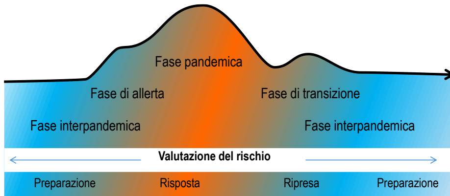
Figura 3 - Andamento delle fasi pandemiche (Fonte OMS)

Queste fasi potrebbero evolvere in tempi differenti in un determinato Paese a seconda della conformazione geografica o di altre caratteristiche legate all'epidemiologia dell'agente eziologico. Pertanto, il diagramma sopra esposto potrebbe apparire diversamente rappresentato a seconda che si esamini una singola regione o l'intero Paese.