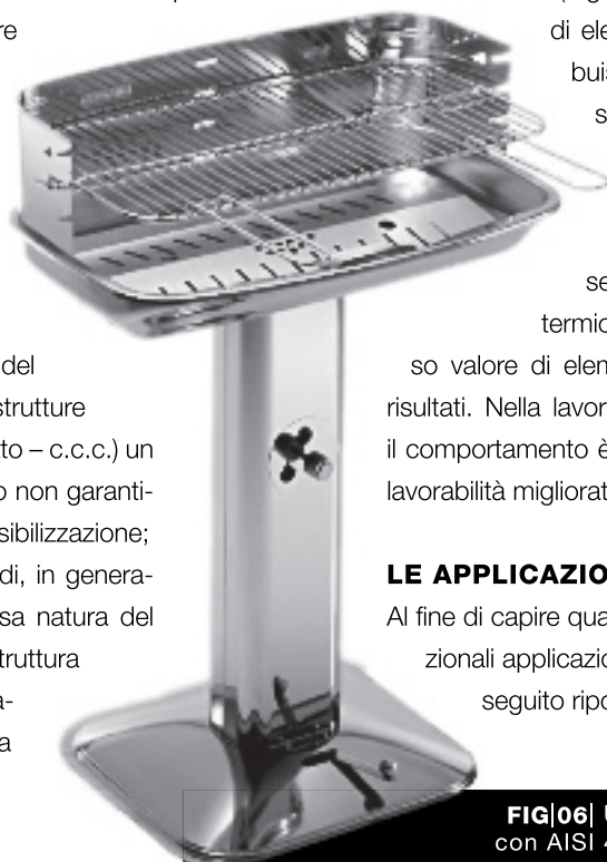
FIG|06 Un esempio di barbecue prodotto con AISI 430 (EN 1.4016).

Al fine di capire quali siano state fino a oggi le più tradizionali applicazioni degli acciai inossidabili ferritici, di seguito riportiamo alcuni tipici esempi.