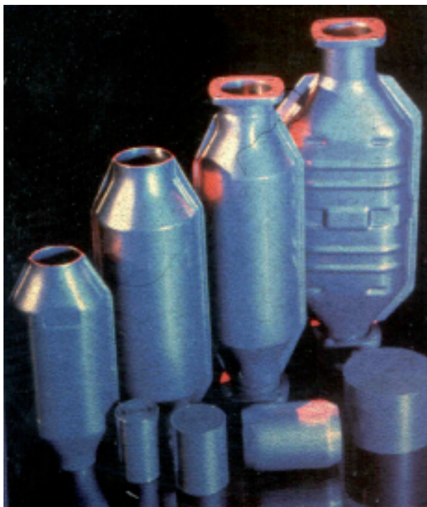
FIG|02| AISI 409 o 439 o type 441 vengono impiegati per i sistemi di scarico.

le diverse tipologie e proprietà, così da delineare le possibilità di utilizzo in taluni settori che, fino ad oggi, sono stati regno incontrastato dei tipi austenitici sopra menzionati.