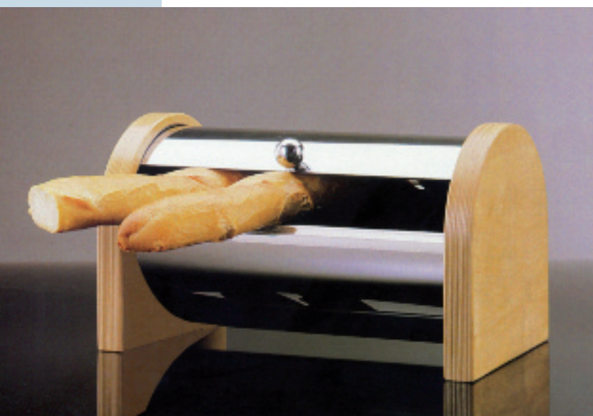
FIG 01 | Inox AISI 430 per la produzione di porta-pane e altri complementi di arredo.

In questo contesto è sembrato opportuno proporre una panoramica sugli acciai inossidabili ferritici per presentarne