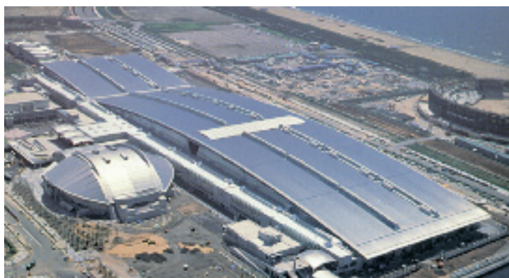
FIG|05 Per il Japan Convention Center, in riva al mare, per la copertura è stato impiegato acciaio inossidabile ferritico contenente molibdeno.

Gli effetti sopra descritti, oggi ben noti e controllabili, hanno sempre costituito un ostacolo all'uso questi materiali; le tecnologie moderne di affinazione (AOD e VOD), unitamente alla conoscenza degli effetti benefici di elementi come titanio e niobio, hanno sicuramente contribuito a dare un maggiore impulso alla diffusione.