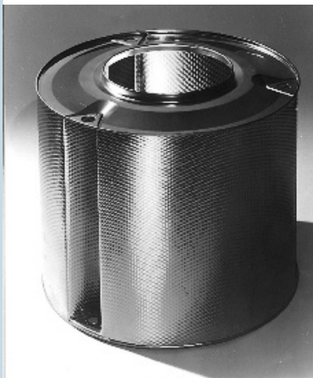
FIG|04 Cestelli delle lavatrici e parti di lavastoviglie sono realizzati con AISI 430 o varianti di questo stabilizzate con titanio o niobio.

Infine quando gli acciai inossidabili ferritici con tenori medi o elevati di elementi interstiziali sono esposti a temperature superiori a 950 °C e quindi portati a temperatura ambiente, tendono a divenire fragili (es. saldature e getti). Per porre rimedio occorre un trattamento termico a 750-850 °C che consente di recuperare la necessaria duttilità.