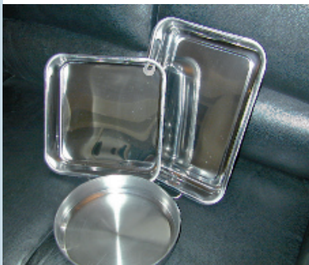
FIG07 Anche nel settore del pentolame l'AISI 430 ha cominciato a sostituire l'AISI 304.

Sulla base di queste semplici considerazioni generali, è abbastanza chiaro che il 444 (1.4521) si delinea come equivalente al 316 in termini di resistenza alla corrosione e quindi valida alternativa più economica in una vastissima gamma