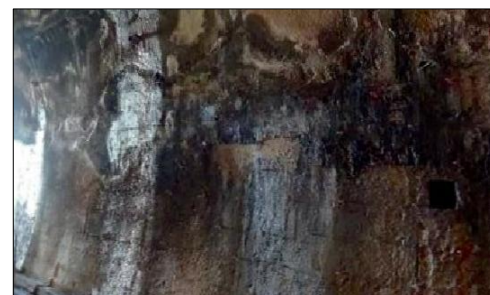
Danno B2 - Fessure diffuse, bagnate