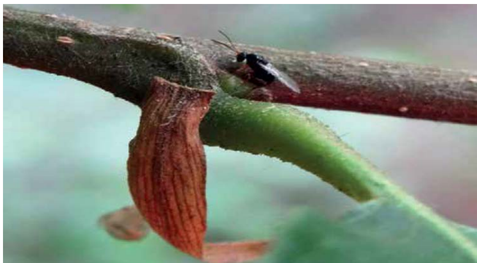
Figura 5 - Cinipide che depone le uova in una gemma