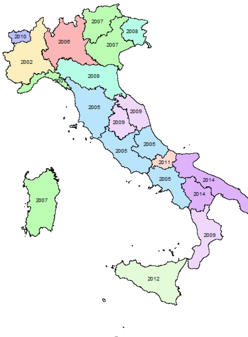
Figura 4 - Espansione del Cinipide del Castagno nelle regioni italiane

In Italia è stato segnalato nel 2002 per la prima volta in Piemonte, in provincia di Cuneo, da dove si è diffuso in pochi anni in tutte le regioni italiane (fig. 4).