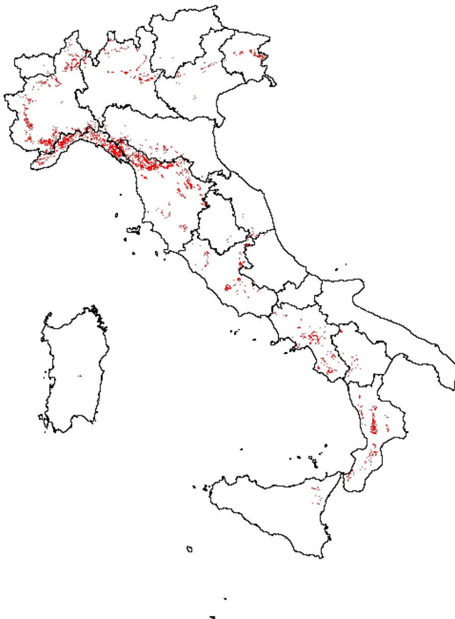
Figura 1 - Distribuzione di Castanea sativa in Italia