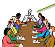
AMMINISTRATORE DEL CONDOMINIO

Provvedimento AdE n.108572 dell'8 giugno 2017 Provvedimento AdE n.165110 del 28 agosto 2017